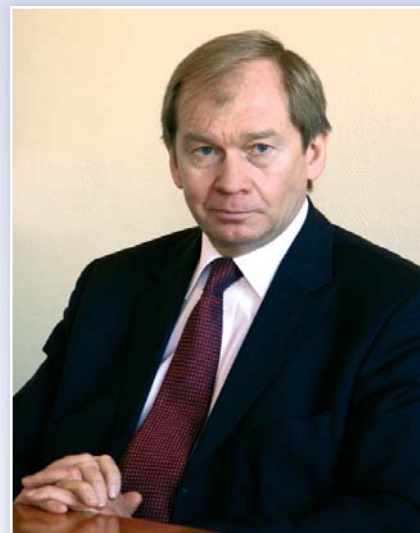
Сергей ПАХОМОВ, председатель Комитета государственных заимствований города Москвы

– Сергей Борисович, не секрет, что мировой финансовый кризис может отразиться и на нашей стране, а это неизбежно повлияет на мировые цены на ведущие российские экспортные товары. Как, на Ваш взгляд, региональные власти должны реагировать на эти сигналы?